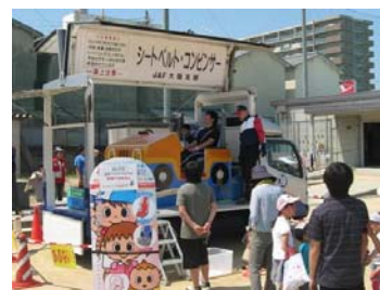
▲シートベルト・コンビンサー