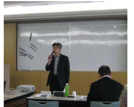
▲ 選考委員の久座長からの講評