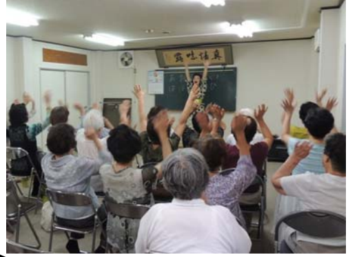
▲「笑ってアンチエイジング」では、全員一緒に笑って「五分間笑う」ことを目標に、初めは戸惑っていた人も講師の大きな笑いにつられるように笑い、皆がひとつになったようであった。

荘内町有志会が主催。荘内・東本町共同集会所にて高齢者を対象にした催し物が行われた。演目は落語やフラダンスなど全5項目。紙芝居は中々見る機会も少なくなっている中、参加者は童心に戻ったようにくぎづけになっていた様子だった。