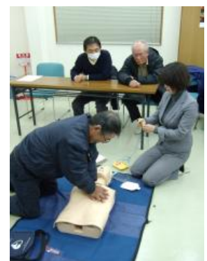
▲ 若林自治会館へのAED設置と救急救命の講習。