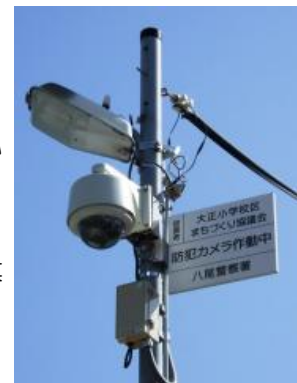
▲ 太田第一公園へ防犯カメラを設置(3月12日)