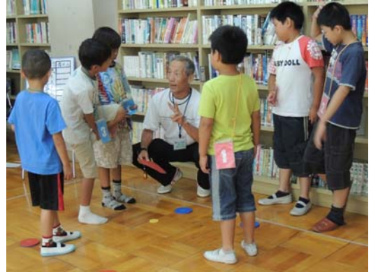
▲小学生も保護者も、試合に白熱。スポーツでふれあい、世代間での交流が深められた。写真は子ども達へのアドバイスの様子。

成法中学校と中学校区内の各小学校及び小中学校PTAが中心となり、子ども達へ世代間交流と夢や希望を持つ機会として平成23年度より開催。前回のテーブルマジック講座に続き、今回はデイスコン講座を開催。