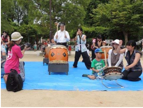
▲催し物では、山本高校和太鼓部による演奏は、市長や子ども達が体験参加し、一丸となった姿が、現場をより盛り上げた。

今回は健康子育て支援団体 thanks to child が人との触れ合いを目的とした祭を開催。祭は積極的な広報活動により大盛況。参加した方も家族連れが多く、祭の開催目的とマッチしたようであった。