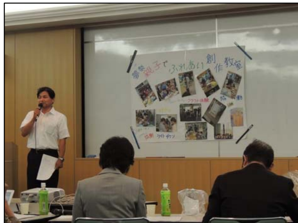
▲「工房夢祭」の発表の様子。手づくりクラフトを披露し、五感で感じる発表表現は、来場者から大きな反響があった。

※ 「八尾市市民活動支援基金事業助成金」の助成事業の決定は、7月に八尾市ホームページで公開予定です。