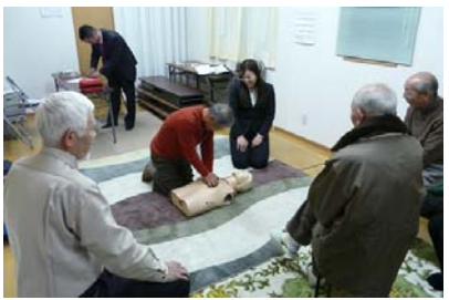
▲ 南木の本新町町会集会所へのAED設置と救急救命の講習。