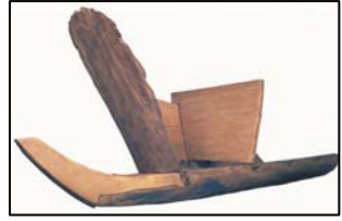
復元準構造船(部分)