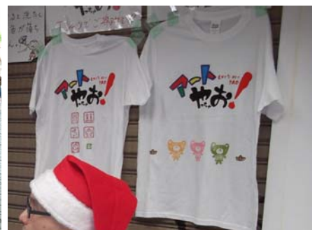
▲ 実際に作成したTシャツ