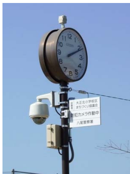
▲ 西木の本4丁目公園へ防犯カメラを設置(3月12日(火))