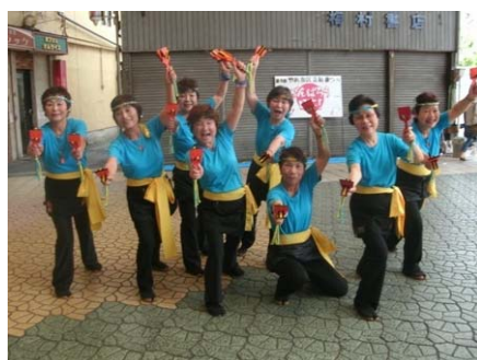
▲ イベントコーナーでは、踊り等を披露