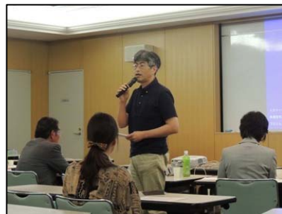
▲審査委員の久会長から 講評の様子。