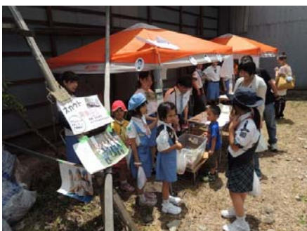
▲ 若者など多様な世代が団体出展

▲ フラダンスとウクレレ演奏のコラボ(ファミサロンえんがわ向かい空地) フラダンス:「クレービカケ」、ウクレレ演奏:「ひとみ会有志」