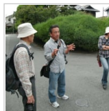
追悼：巨匠逝く！ 22時間前