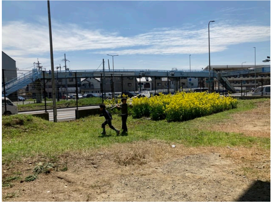
虫取り網で虫を探しているエコロジー美園小の子どもたち。