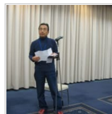
追悼：巨匠逝く！ 22時間前