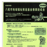
あなたの「やって 2時間前