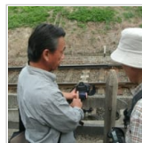
追悼：巨匠逝く！ 22時間前