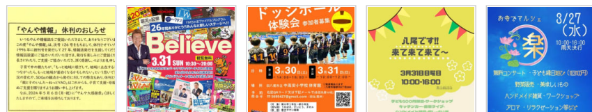
「やんや情報」休刊 2日前 FMちゃおフィナーレ 3日前 公式ドッジボール体験会 7日前 月末はイベントが 2週間前 月末はイベントが 2週間前