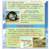
志紀小学校校区で開 2日前