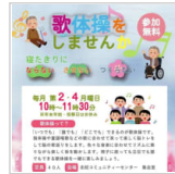
志紀小学校校区で開 2日前