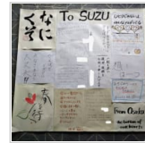
被災地にお届けし 6日前