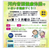
志紀小学校校区で開 2日前