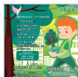
第32回合唱祭のお 7日前