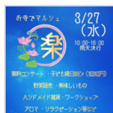
月末はイベントが 4日前