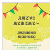
月末はイベントが 4日前