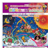
八尾市内で開催さ 6日前