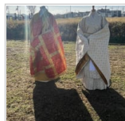
史跡由義寺跡体験