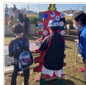
史跡由義寺跡体験