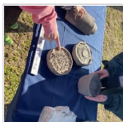
史跡由義寺跡体験