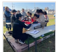
史跡由義寺跡体験