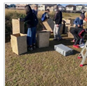
史跡由義寺跡体験