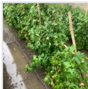
棉の収穫祭に参加 1日前