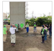
棉の収穫祭に参加 1日前