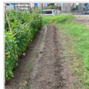
棉の収穫祭に参加 1日前