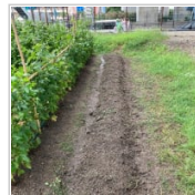
棉の収穫祭に参加 1日前