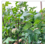
棉の収穫祭に参加 1日前