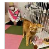
『譲渡型ねご空間 2日前