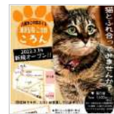
『譲渡型ねご空間 2日前