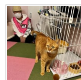
『譲渡型ねご空間 2日前