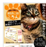
『譲渡型ねご空間 2日前