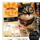
『譲渡型ねご空間 2日前