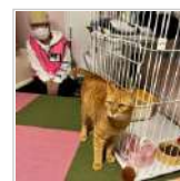
『譲渡型ねご空間 2日前