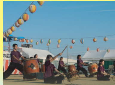
(7日、大阪府立山本高等学校和太鼓部)