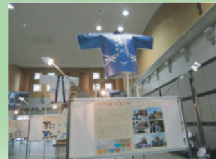
(やおの祭りまっぴ 2016)