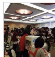
開催場所のジレンマ 1週間前