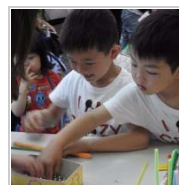
開催場所のジレンマ 1週間前