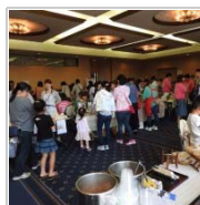
開催場所のジレンマ 1週間前