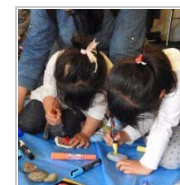
開催場所のジレンマ 1週間前