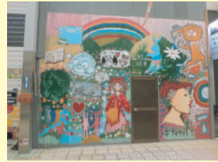
▲ファミサロン「えんがわ」向い側

そして、旧近鉄八尾駅前の商店街城正会からも、夏の盆踊りに向けて商店街を絵で飾りたいとお話が来たそうです。商店街のどこに、どんな絵ができるのでしょうか。完成が楽しみ！商店街と市民活動団体との協働で八尾の街が元気づき、人の往来が増えて、街が賑やかになればいいですね！