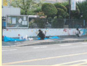
▲(公社)シルバー人材センター