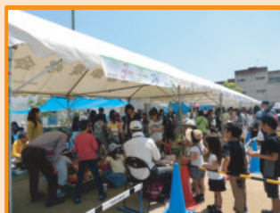
▲ヨーヨー釣り子ども達に大人気！

校区まちづくり協議会を中心に、各町会、龍華中・小・幼 PTA の多くのブースが並び、大賑わい。長〜い行列ができていますお店もありました。