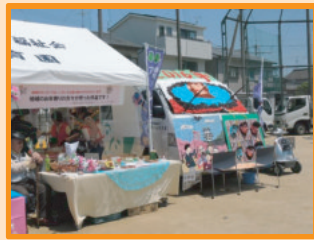
▲地域包括支援センターのブース。リフト付き介護自動車の飾りつけがカワイイ！

八尾市各地でおこなわれる「ふれあいまつり」のトップをきって龍華地区の「地域生き生きふれあい祭り」が龍華小学校で開催されました。