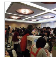
開催場所のジレンマ 6日前