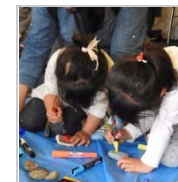
開催場所のジレンマ 6日前