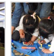
開催場所のジレンマ 5日前