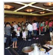
開催場所のジレンマ 5日前