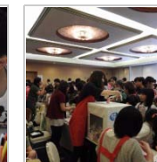
開催場所のジレンマ 5日前