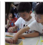
開催場所のジレンマ 5日前