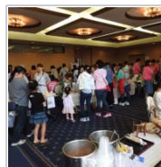
開催場所のジレンマ 6日前