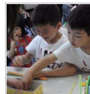
開催場所のジレンマ 6日前