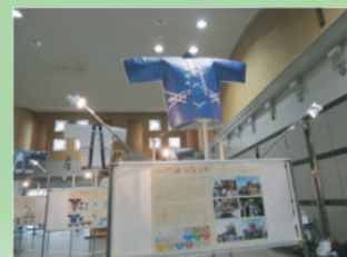
(やおの祭りまっぴ 2016)