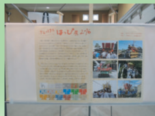
(2016年「かえってきたはっぴ展」)